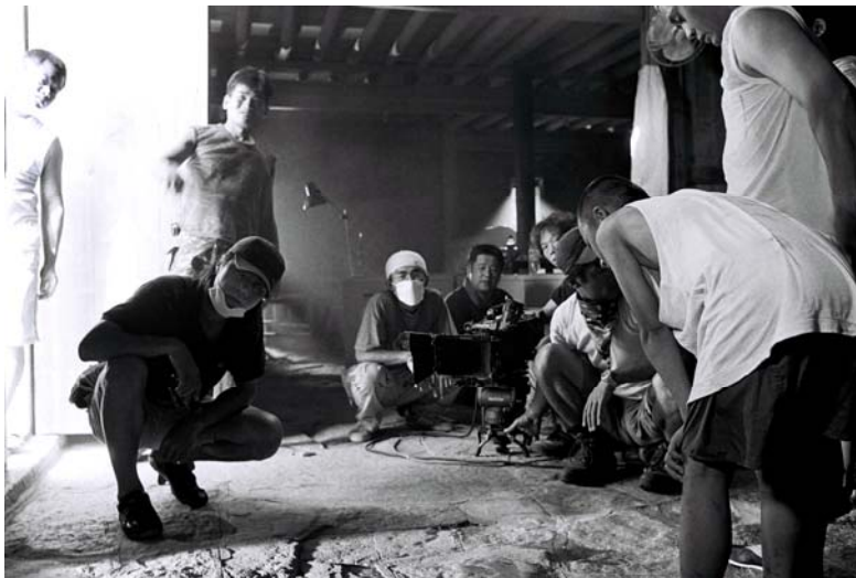
瞿導拍攝「英勇戰士 俏姑娘」工作照

所以，有一些話我可能想藉這裡，告訴那個名叫“創作”的我的孩子：未來你如果誕生後，可能隨時都需要擔心被綁架，有時綁架你的人可能只是國小學生，我又怎麼能狠心也綁架他們，讓他們父母感受一下失去孩子的痛苦？我只能提醒你，以後被綁架時，一定要大聲說出自己的名字，讓歹徒不要認錯，還要期待綁匪良心發現，付給你的父母一點點生你養你的車馬費，這僅是卑賤的一點點請求，如果……如果在這樣不停地被不重視智慧財產權的歹徒傷害之後，在未來，我還有一點創作的力氣，還生得出你的話，我很想請她們就算要綁架你，也要好好善待你！